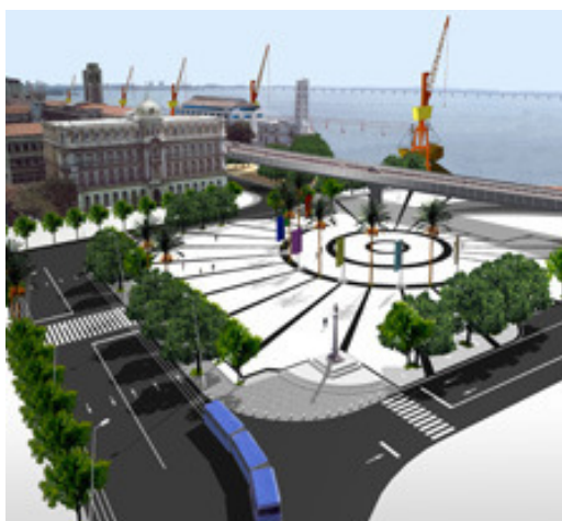
Figura 3: Representação do projeto para Praça Mauá